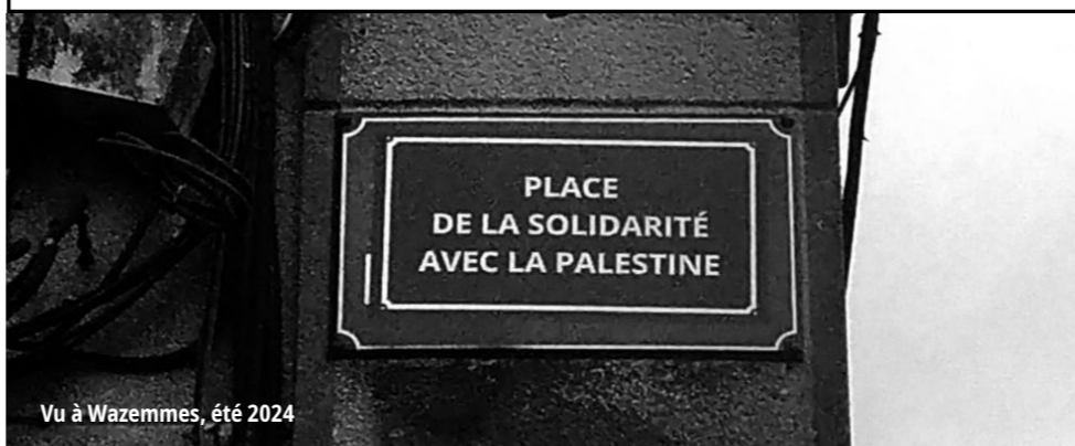
Vu à Wazemmes, été 2024

Alors face à ça, déployons notre solidarité antifasciste !!!