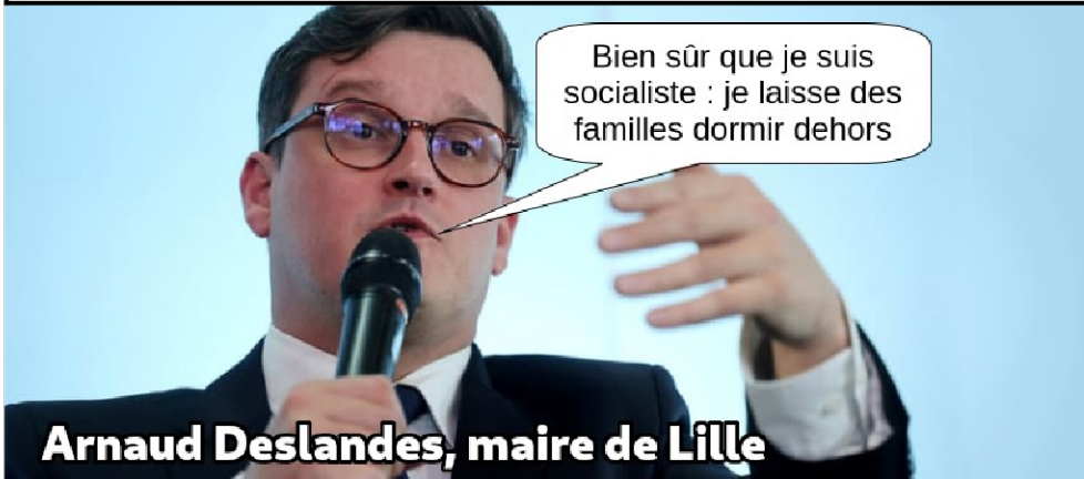
Arnaud Deslandes, maire de Lille

Que la Justice les juge coupables, ça nous importe peu, cette situation est avant tout provoquée par les États européens qui traquent les personnes exilées, par les accords migratoires mortifères entre la France et l'Angleterre et, dans ce cas, par la dictature érythréenne qui force tant de gens à partir.